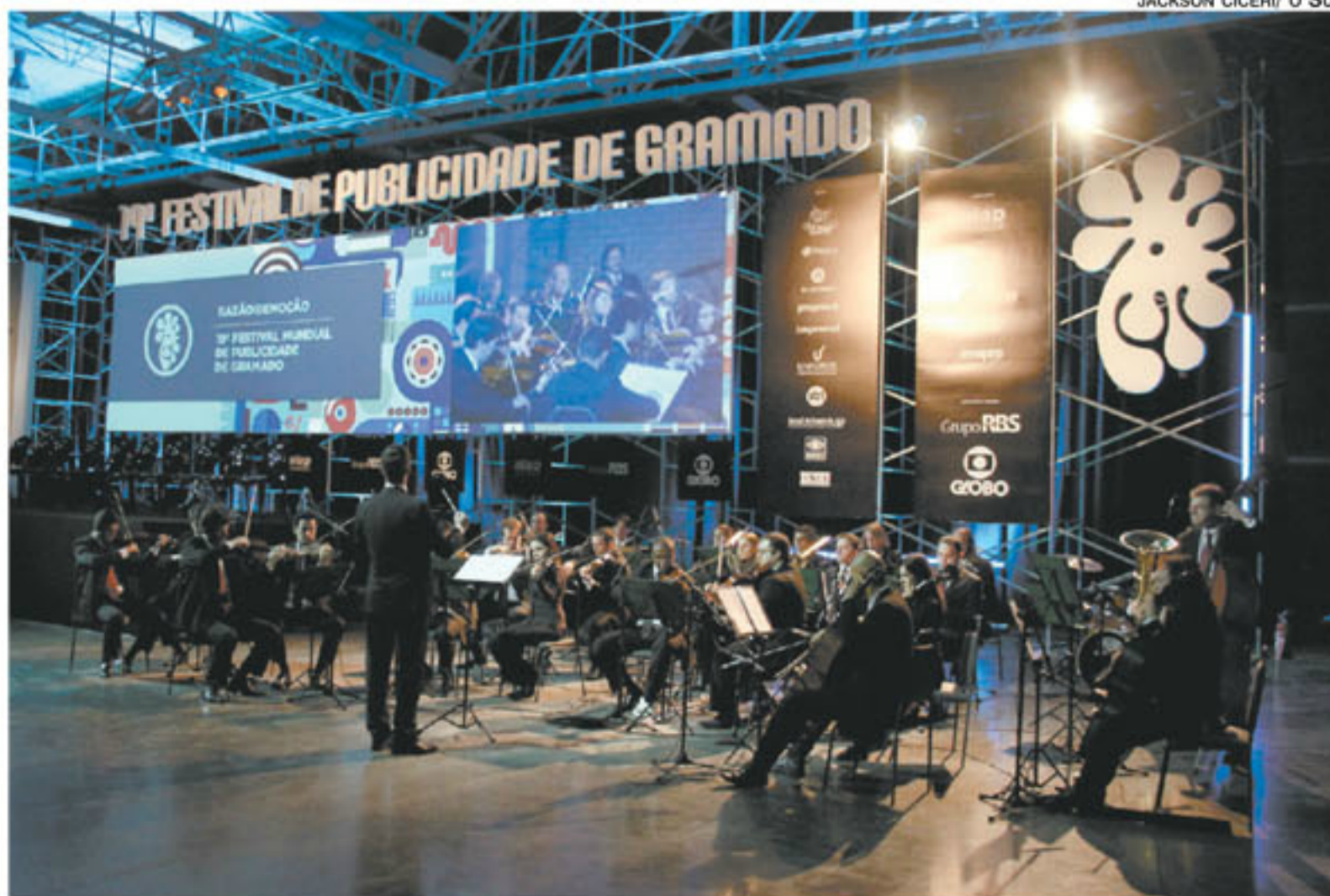
ORQUESTRA Sinfônica de Gramado emocionou o público. O festival tem extensa programação hoje e amanhã.

Na abertura do festival, a Orquestra Sinfônica de Gramado emocionou o público presente, composto em sua maioria por jovens. Na presen-